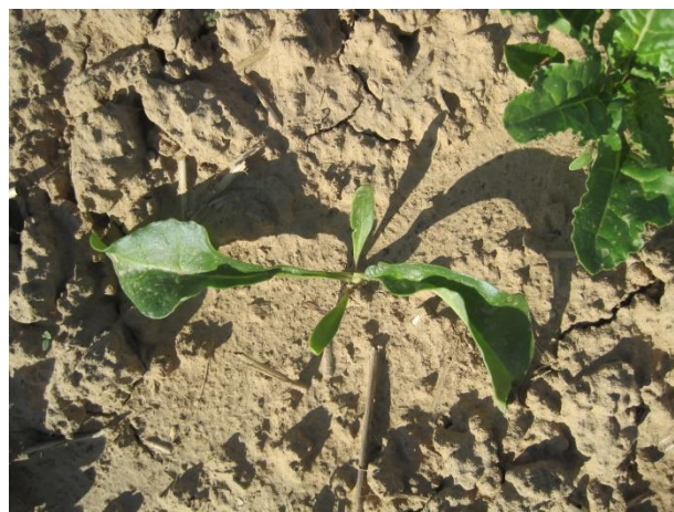
Повреждение свеклы гербицидами при применении в жаркую погоду